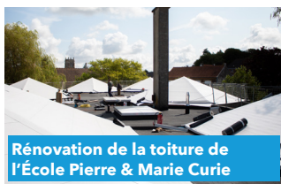
Rénovation de la toiture de l'École Pierre & Marie Curie