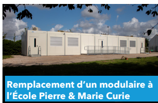
Remplacement d'un modulaire à l'École Pierre & Marie Curie