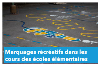
Marquages récréatifs dans les cours des écoles élémentaires

Pendant l'été, nos établissements Anne Frank et Pierre & Marie Curie ont fait peau neuve ! Pour offrir à vos enfants un accueil des plus joyeux, des marquages de jeux colorés ont été installés dans ces deux écoles. De plus, à Bois-en-Ardres, l'école Pierre & Marie Curie a été rénovée. Nous souhaitons à nos jeunes Ardrésiennes et Ardrésiens une excellente rentrée, synonyme de réussite !