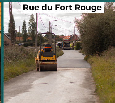
Rue du Fort Rouge