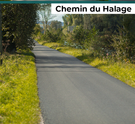
Chemin du Halage